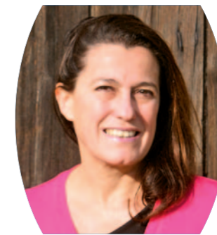
Sylvie GUERRY-GAZEAU Maire