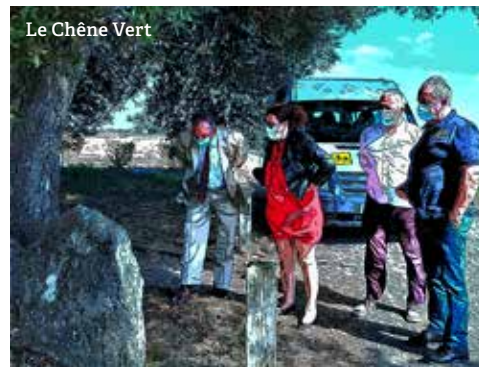
Le Chêne Vert