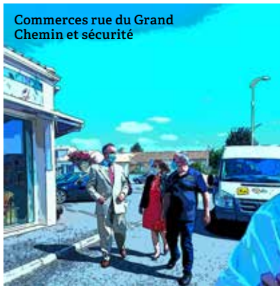
Commerces rue du Grand Chemin et sécurité