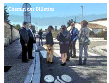
Chemin des Billettes