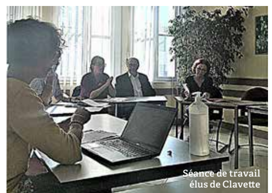
Séance de travail élus de Clavette