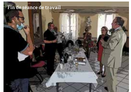
Fin de séance de travail