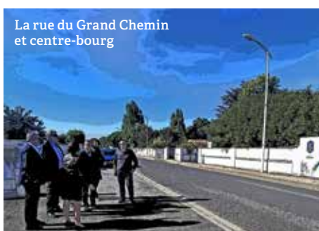
La rue du Grand Chemin et centre-bourg