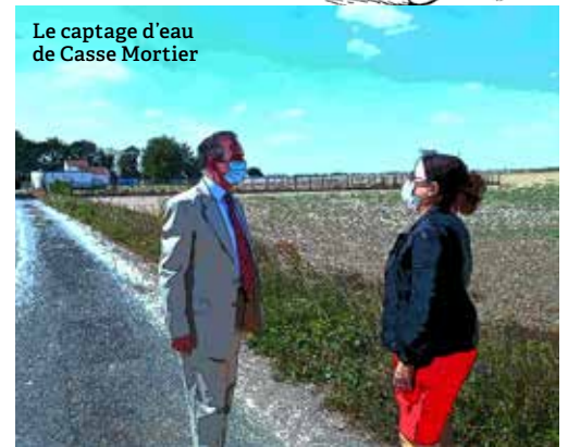
Le captage d'eau de Casse Mortier