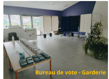
Bureau de vote - Garderie

En France il y a eu cinq Républiques. Les présidents de la 5ème République sont : Charles DE GAULLE, George POMPIDOU, Valéry GISCARD D'ESTAING, François MITTERRAND, Jacques CHIRAC, Nicolas SARKOZY, François HOLLANDE et Emmanuel MACRON (au moment où nous écrivons cet article, nous ne savons pas qui a remporté les élections de 2022).