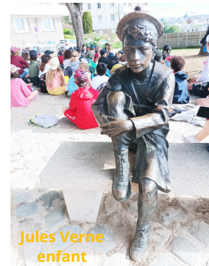
Jules Verne enfant