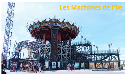
Les Machines de l'île

Le 13 mai nous sommes revenus à l'école à 19h50.