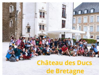
Château des Ducs de Bretagne