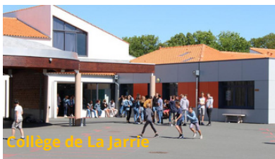
Collège de La Jarris

Non, et l'on sait que nous nous ferons de nouveaux amis.