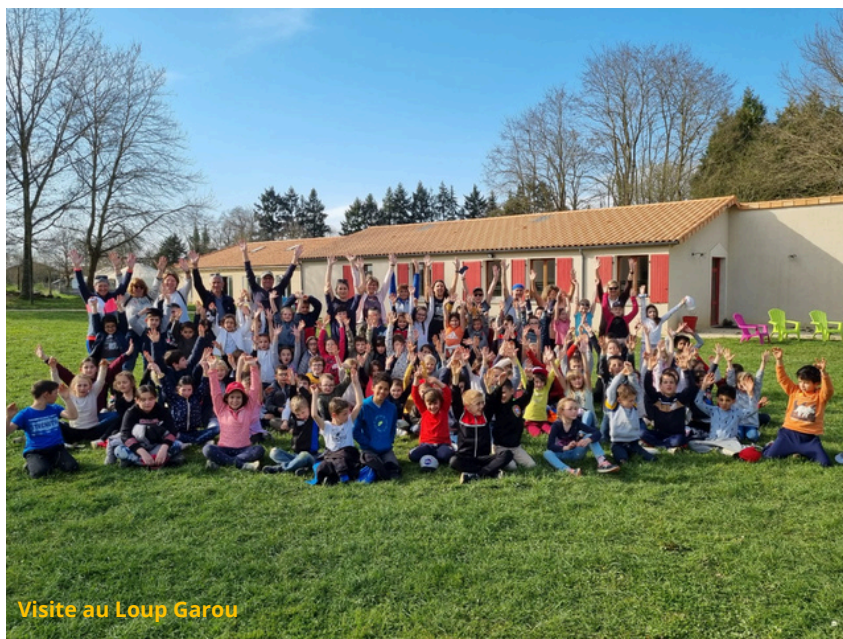
Visite au Loup Garou