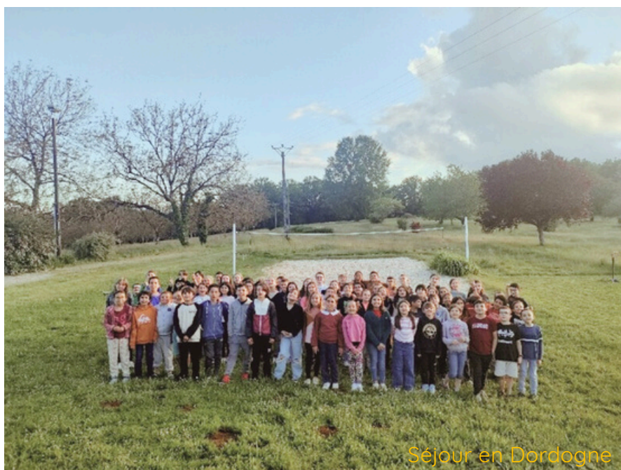
Séjour en Dordogne