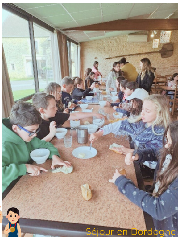
Séjour en Dordogne